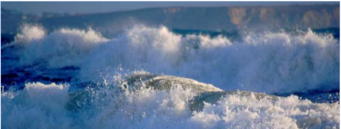
Echappées Breizh Photographiques